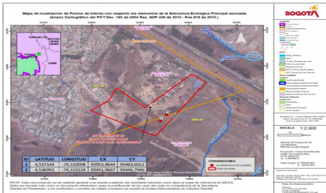
IMAGEN N° 1. Cartografía Oficial – Ubicación Geográfica Predio AC 71B SUR 10 21

A continuación, en la siguiente imagen se ilustra la localización espacial de los puntos donde se encontraron los residuos dispuestos de forma incorrecta y la ubicación geográfica del predio: